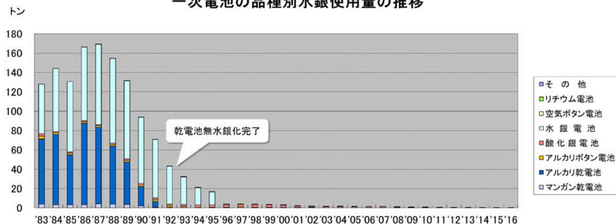
一次電池の品別水銀使用量の推移